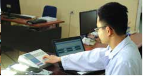
Thiết bị đo nhiệt 16 kênh là thiết bị xác định nhiệt độ trực tiếp của 16 linh kiện cùng một lúc, có khả năng lưu giữ nhiệt độ liên tục