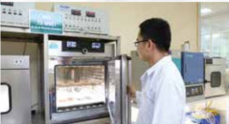
Thiết bị tạo môi trường khắc nghiệt đánh giá độ tin cậy sản phẩm. Nhiệt độ cao & độ ẩm cao, sốc nhiệt -40°C/100°C