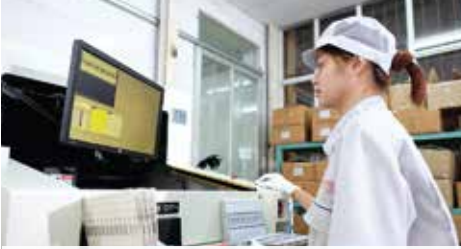
AOI: Máy kiểm tra quang học tự động phát hiện lỗi gần sai linh kiện, sai lệch tọa độ linh kiện cỡ 1/1000 mm.