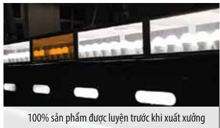
100% sản phẩm được luyện trước khi xuất xưởng