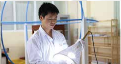
Thiết bị kiểm tra khả năng tương thích điện từ của đèn