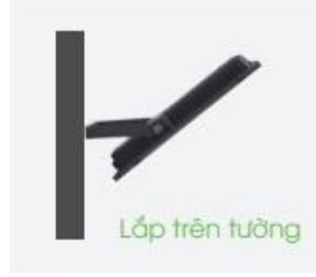
Lắp trên tường