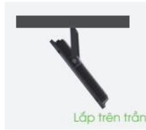
Lắp trên trần