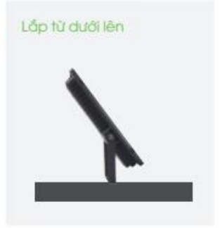
Lắp từ dưới lên