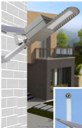
Đèn được lắp trên tường