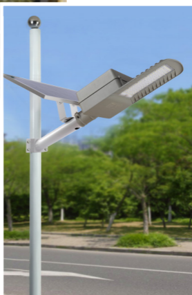
Đèn được lắp trên cột